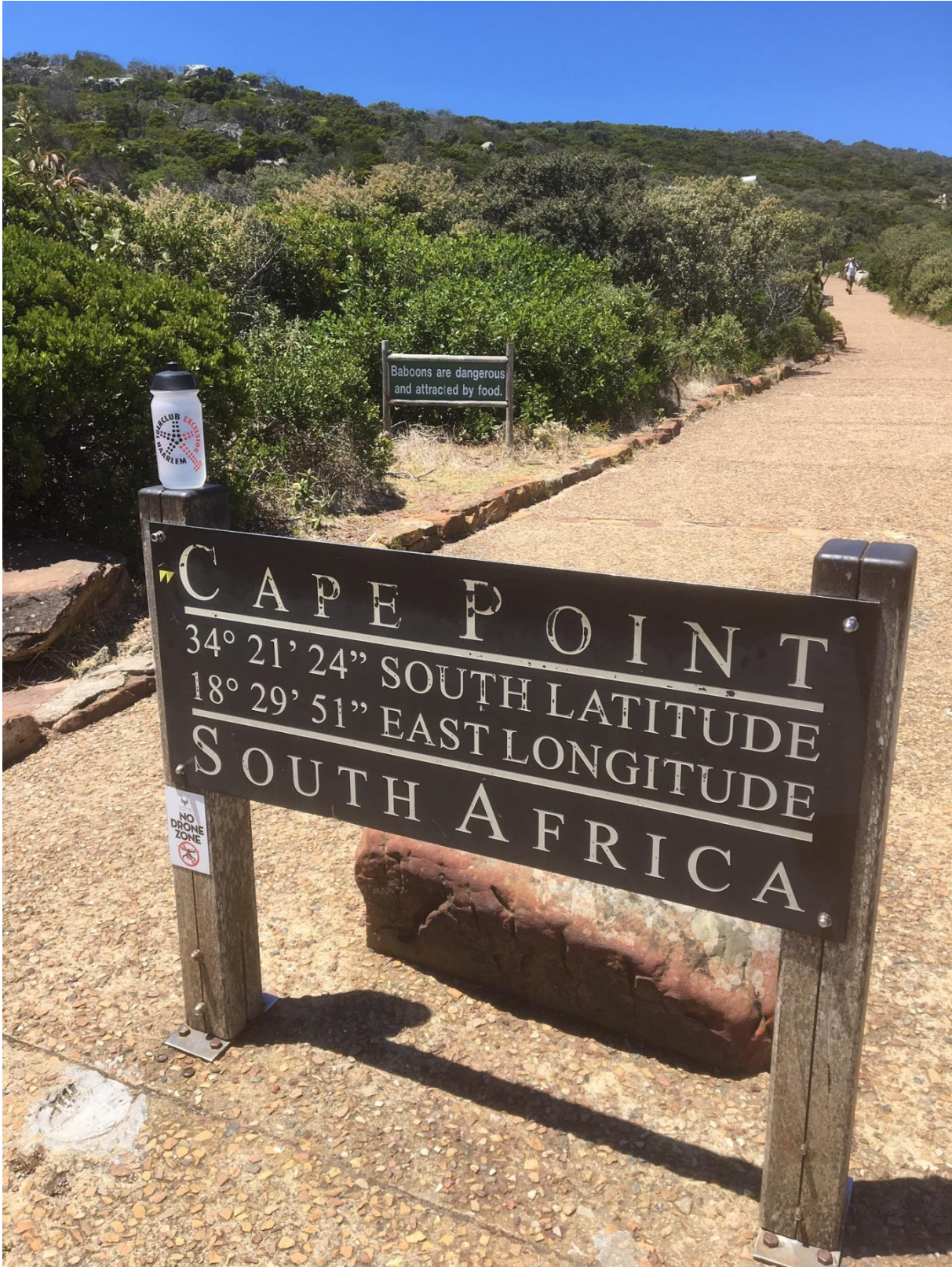
Jacob Bruijn in 2019, locatie is duidelijk!