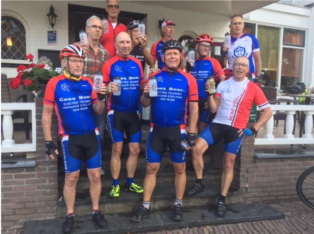
Deelnemers fietsweekend 2017 in Ootmarsum. En allemaal een bidon in handen!!