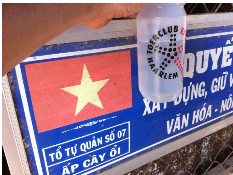
In Zuid Vietnam

Cor Zwaan heeft tijdens zijn fietstocht op een paar mooie locaties in Vietnam en Cambodja deze foto's gemaakt; uiteraard met bidon!