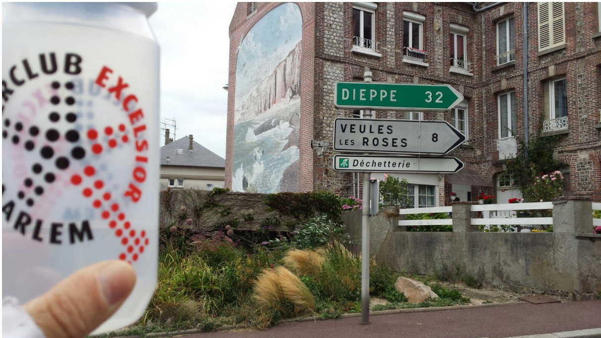
Ook hier in het mooie Frankrijk is de TC aan het trainen.