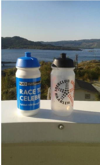
Wilbert Mesman: foto's gemaakt in Bergen, Noorwegen! Tijdens het WK Wielrennen!